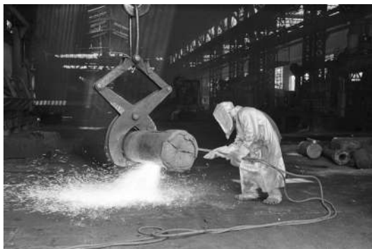
Images du travail - M. Ayrault